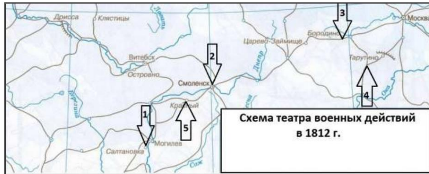
Схема театра военных действий в 1812 г.

I) Хвала тебе, славян любовь, Наш ... (пропущено имя) смелый!.. Ничто ему толпы врагов, Ничто мечи и стрелы; Пред ним, за ним Перун гремит, И пышет пламень боя... Он весел, он на гибель зрит С спокойствием героя... II) Великодушный русский воин, Всеобщих ты похвал достоин: Себя и юных двух сынов — Приносишь всё царю и богу; Дела твои сильнее всех слов.. Ведя на бой российских львов, Вещал: «Сынов не пожалеем, Готов я с ними вместе лечь, Чтоб злобу лишь врагов пресечь!.. Мы россы!.. умирать умеем» III) Смоленский князь, вождь дальновидный, Не зря на толк обидный, Великий ум в себе являл, Без крови поражал